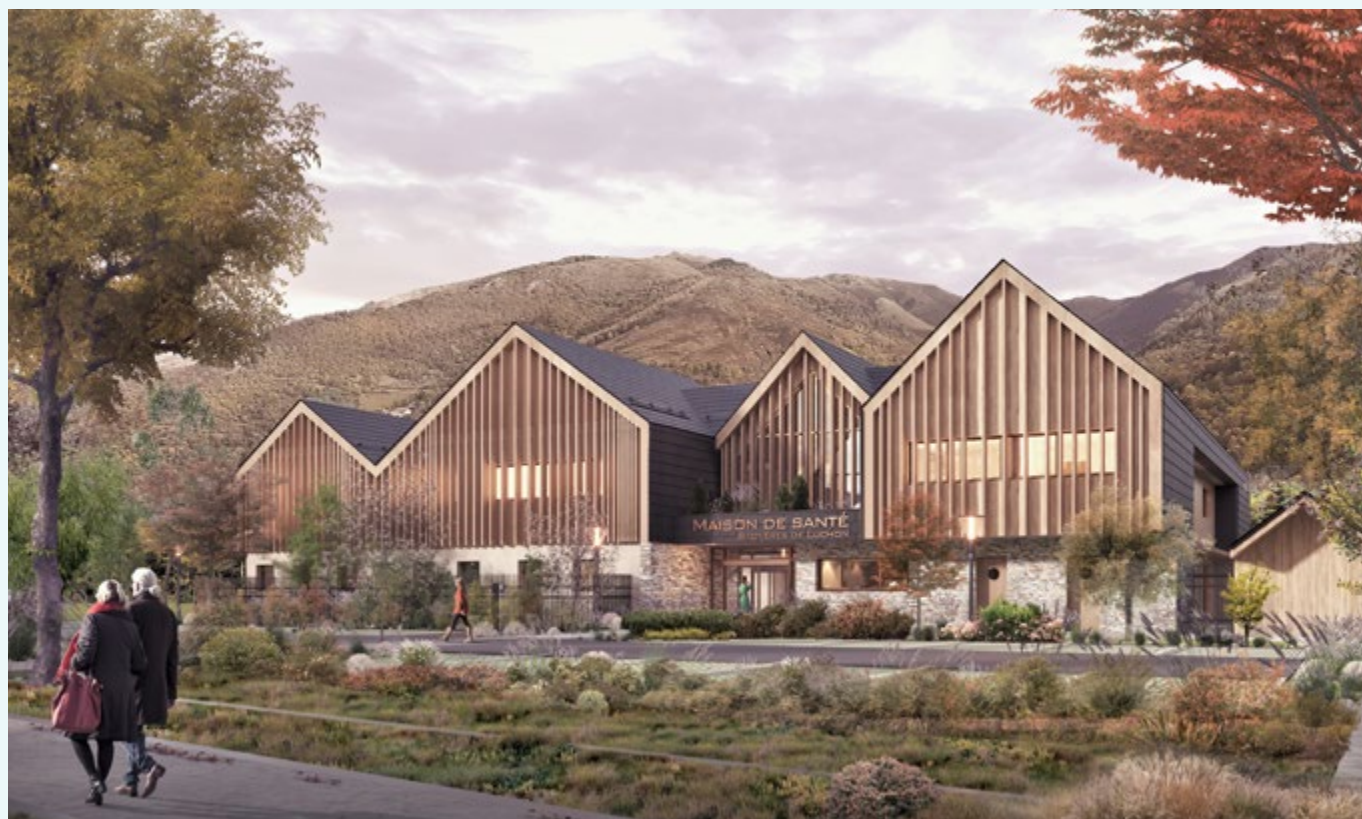
Future Maison de santé à Bagnères-de-Luchon (en lieu et place du cynodrome)