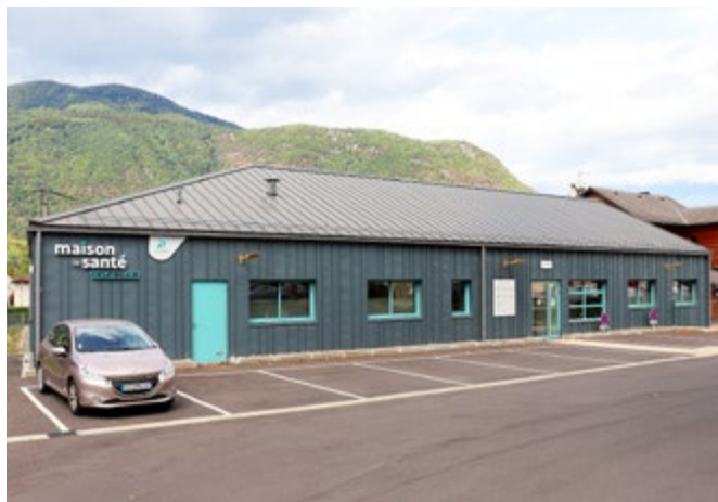
Maison de santé de Marignac (près de la gare)