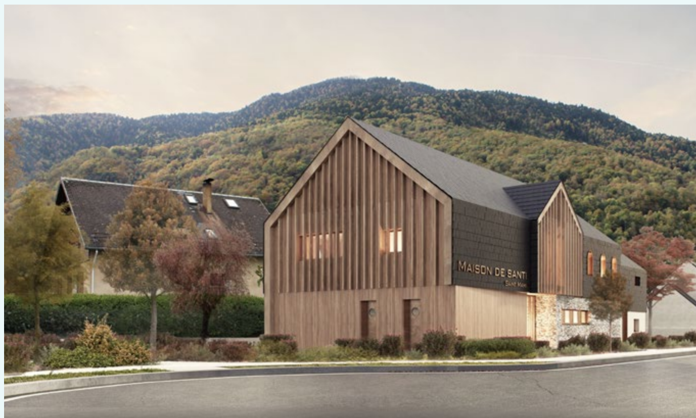
Future Maison de santé à St-Mamet (Avenue de la Pique)

Préalable indispensable à la création d'une maison de santé, le regroupement de professionnels de santé autour d'un projet de santé permet de garantir l'engagement des professionnels de santé pour occuper et faire vivre cet équipement. À ce jour, il n'y a pas de structuration de ce type dans le Haut-Comminges.