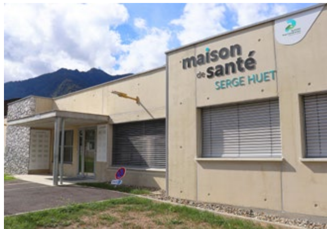
Maison de santé de St-Béat-Lez (entre la piscine et le collège)